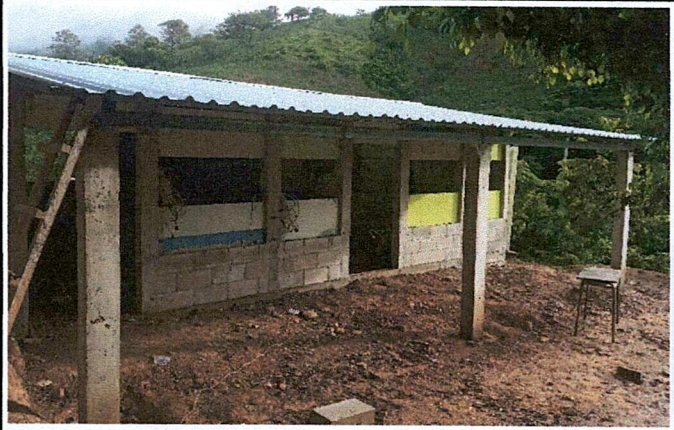
Foto 4: MEJORAMIENTO DE ESTRUCTURA TIPO PORTICO E INSTALACION DE LÁMINAS TROQUELADAS CAL. 26. Y MEJORAMIENTO DE LOSA DE PISO (TIPO TORTA) E INSTALACION DE PUERTAS Y VENTANAS.

Observación: Si es necesario se pueden agregar hojas adicionales y actualizar el número de hojas.