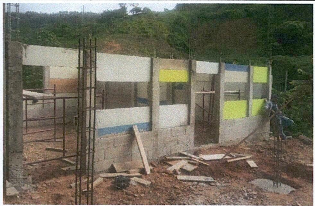
Foto 2: 2. MEJORAMIENTO DE ESTRUCTURA TIPO PORTICO E INSTALACION DE LÁMINAS TROQUELADAS CAL. 26.