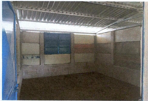
Foto 3: 3. MEJORAMIENTO DE LOSA DE PISO (TIPO TORTA) E INSTALACION DE PUERTAS Y VENTANAS.